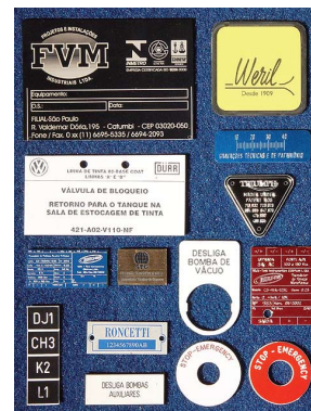
Placas de Identificação