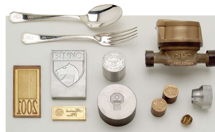
Etiquetas de Identificação