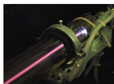
Canhão Laser CO 2