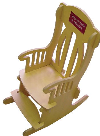
Móveis e Brinquedos