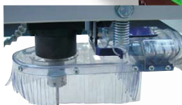
Removedor de pó e cavacos com escova e mangueira.