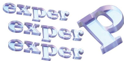
Recorte de Letra Caixa