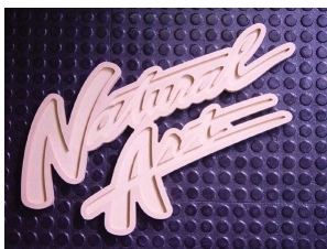
Placas de Sinalização