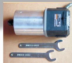
Porter Cable 3,25 HP com 4 velocidades até 21.000 rpm