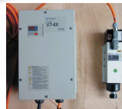
Eletromandril 2, 3, 4 ou 5HP com inversor de frequência, baixo ruído e velocidade até 18000 rpm com alto torque.