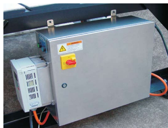
Eletrônica Alpha montada em caixa industrial blindada contra pó; sistema de refrigeração com dissipadores externos. Alta proteção e baixo custo de manutenção.

A Aviso disponibiliza vários modelos que aliam baixo custo com precisão e velocidades ideais às diversas atividades.